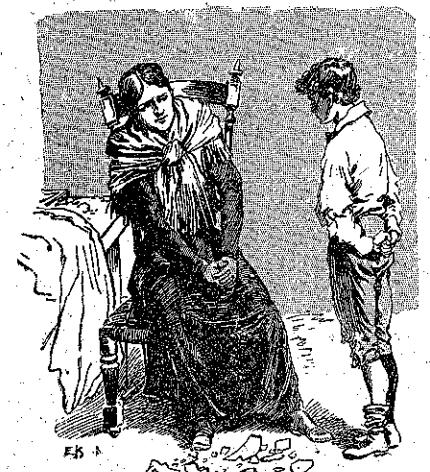
«Αὐτὴ πού ἔλεγε πάντα, ὅτι τὸ καλὸπαιδί, ὁ γυῖός της...» (Σελ. 230, στ. γ')

Ὁ μικρὸς δὲν ἐτόλμησε νὰ μὴ δε- χθῆ χρήματα, τὸσον εὐγενῶς προσφε- ρόμενα, κ' ἐφύλαξε τὸ πορτοφόλι εἰς τὴν σπέχη του. Τότε ὁ Καριέτ τοῦ ἔχωσε τὸ κα- κῆττον τοῦ ὡς ταῦτα, τοῦ ἐσύστησε νὰ τυλίξῃ καλὰ τὸν λαμπρὸν του μὲ τὸ φουλάρι του, καὶ τέλος τὸν ἔδεσεν ἀπὸ τὴν μέσην μ' ἓνα δερμάτινον λουρί εἰς τὸ ἐδώλιον τοῦ ἀεροπλάνου.